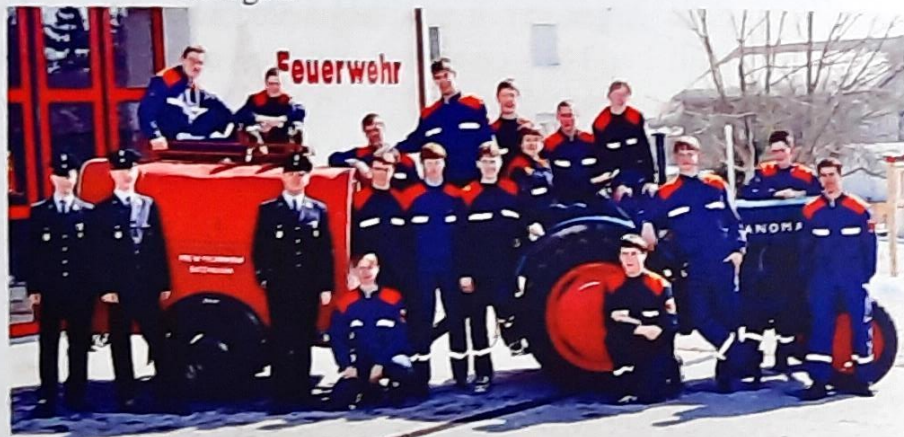
Das Bild zeigt die Jugendgruppen von 1999