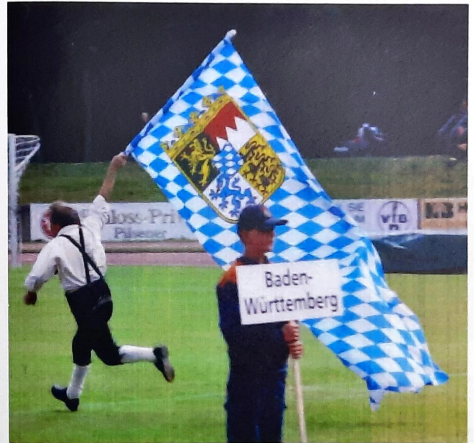
2. Vorstand Josef Schlierf während der Siegerehrung beim bisher größten Erfolg der Batzhauser Jugendfeuerwehr, dem 3. Platz beim Bundesentscheid in Dillingen / Saarland.